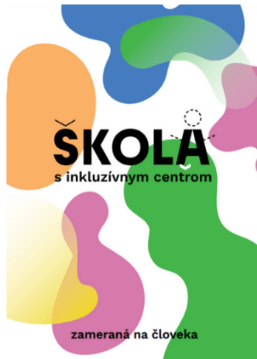
5 Bulletin Škola s inkluzívnym centrom

Od 1. júla 2020 vybuďovalo Inklucentrum v 19-mesačnom projekte pevné základy fungovania, : Od mikro úrovne vzdelávania a poradenstva k mezoúrovni tréningu trénerov, pilotovaní nových vzdelávacích programov a metód až po makro úroveň sieťovania inkluzívnych organizácií v školstve a vytváraní politiky v národnej Stratégii inkluzívneho vzdelávania. Projekt pripravil pôdu aj pre lokálny projekt Školy s Inklucentrom , ktorý bude poskytovať vzdelávanie a podporu učiteľom, deťom a rodinám a asistenciu školám a samosprávam pri zavádzaní inkluzívneho vzdelávania. Skúsenosti z praxe sa následne využijú na úrovni národných politík v podobe koordinátora advokačnej činnosti Koalície za spoločné vzdelávanie (Inklukoalícia) a ako partner pri tvorbe národnej Stratégie inkluzívneho vzdelávania, čím projekt prispel aj k tvorbe vhodného prostredia pre organizácie občianskej spoločnosti, pôsobiace v tejto oblasti. Viac o projekte na stránkach inlucentra.