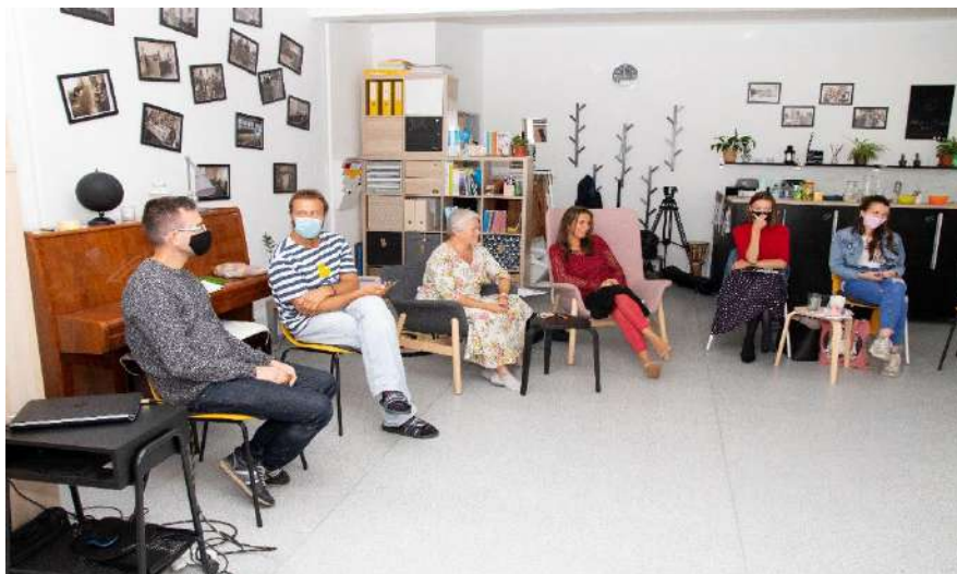
2 Účastníci akreditovaného kurzu Facilitatívne a reflektívne učenie