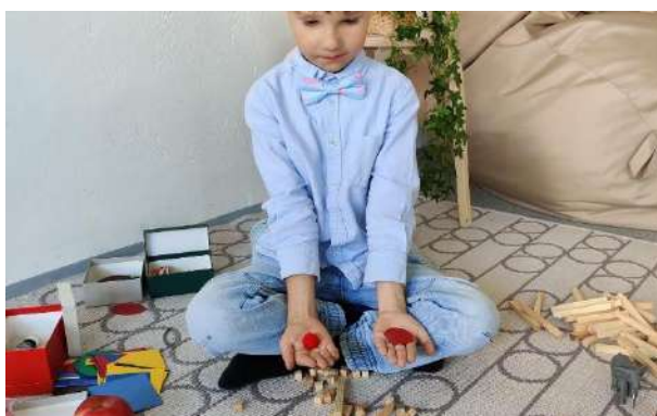
4 Grunnlaget pomôcky