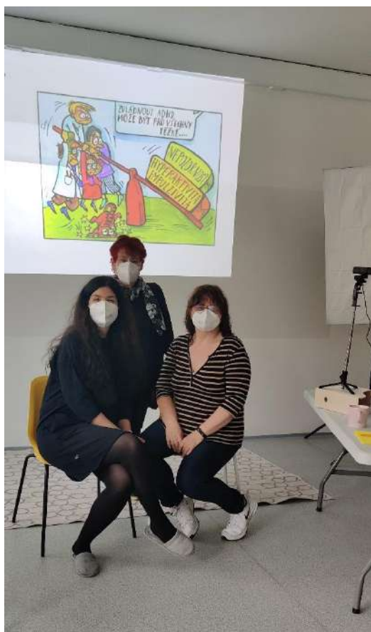
1 Lektorky akreditovaného kurzu Pedagogický asistent v praxi