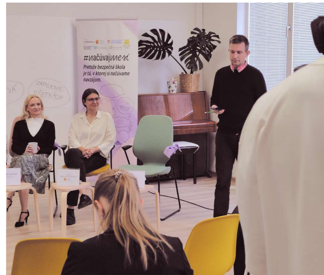
Novinárske raňajky a predstavenie iniciatívy #Načúvajmesi.